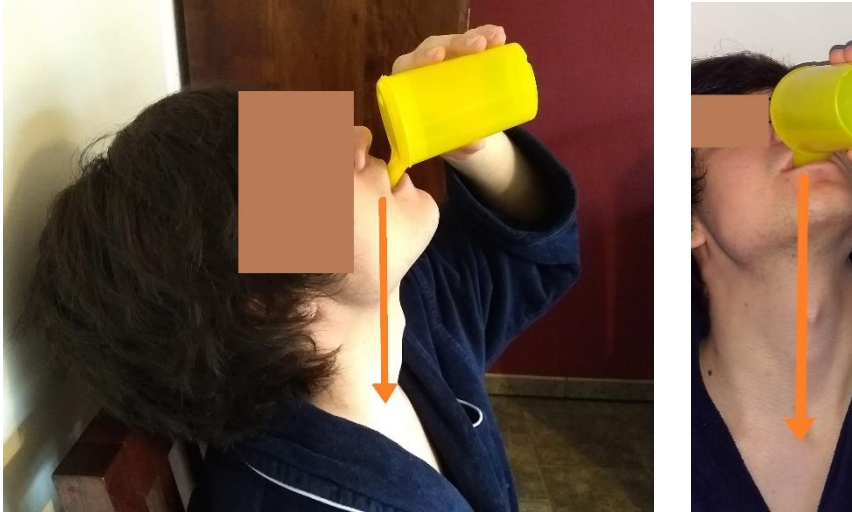
Abb.5 Schnabelbecher: überstreckter Kopf → offene ungeschützte Atemwege

- kein Schnabelbecher, da Kopf überstreckt → ungeschützte Atemwege!!!