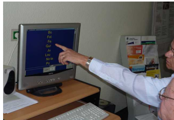
(Aphasische Mitglieder des LVSB e.V. beim PC- gestützten Sprachtraining)

Die Umwelt kann dem von Aphasie Betroffenen die Möglichkeit der Teilhabe am Gespräch und somit die Integration in das gesellschaftliche Leben erheblich erleichtern indem sie einige sehr wichtige und leicht umsetzbare Regeln beachtet: